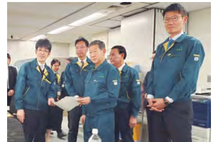
■環境省災害対応オペレーションルーム視察