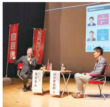
■W政務官のトークセッション

2023年12月9日に開催しました国定勇人国政報告会では、大勢の皆様にお越しいただきありがとうございました。もうひとりの環境大臣政務官 朝日健太郎参議院議員をお招きし、現在注目される環境行政についての活動をご披露させていただきました。次回もお楽しみに。