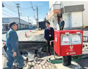
■新潟市西区「液状化被害」視察・要望聞き取り