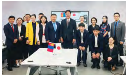
モンゴル自然環境・観光省との政策対話 （モンゴル）