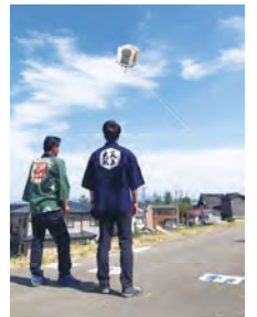
見附今町長岡中之島 大風合戦