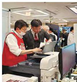
原子力規制庁ERC視察