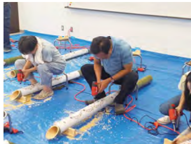
たがみバンブーブー 2023