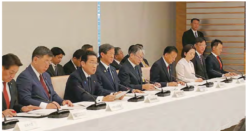
■原子力総合防災訓練2日目本部運営訓練