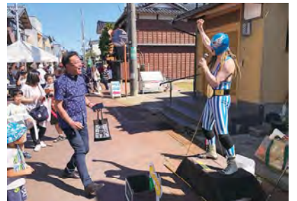
月潟産業 フェスティバル