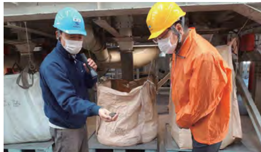
リサイクル工場視察（静岡）