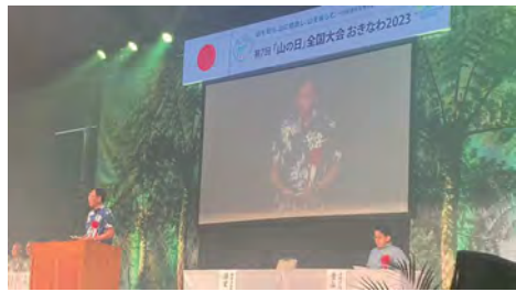
第7回「山の日」全国大会おきなわ2023（沖縄）