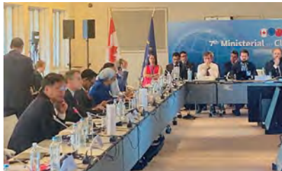
第7回気候変動行動に関する閣僚会合 （ベルギー）