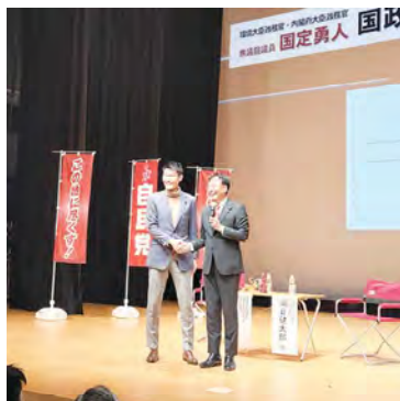
■身長199cmには会場も驚き!