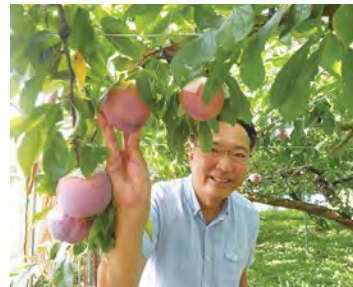
とみやま農園 プラム栽培視察 (南区)