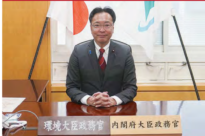
環境大臣政務官 内閣府大臣政務官