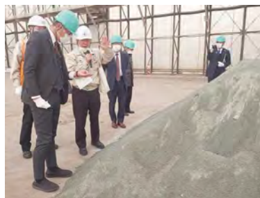
道路盛土実証事業視察（福島）