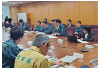
■環境省非常災害対策本部