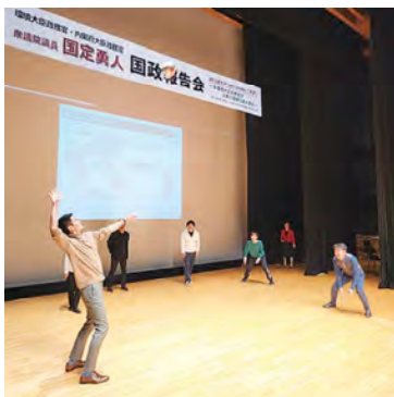
■来場者の皆様と本気バレー🏐