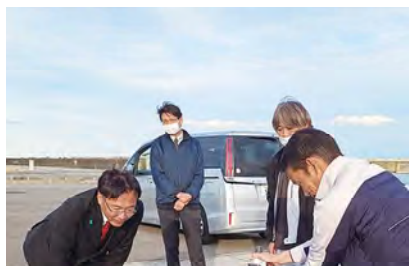
ALPS処理水海域モニタリング視察（福島）