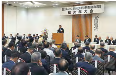
石上大橋下流橋期成同盟会 総決起集会 (三条市)