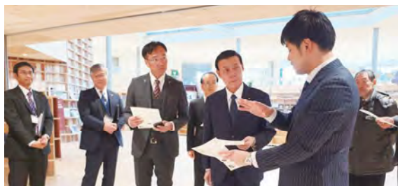
大熊町学び舎夢の森視察（福島）