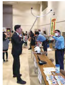
ふるさとシゴト博 2023 in 加茂