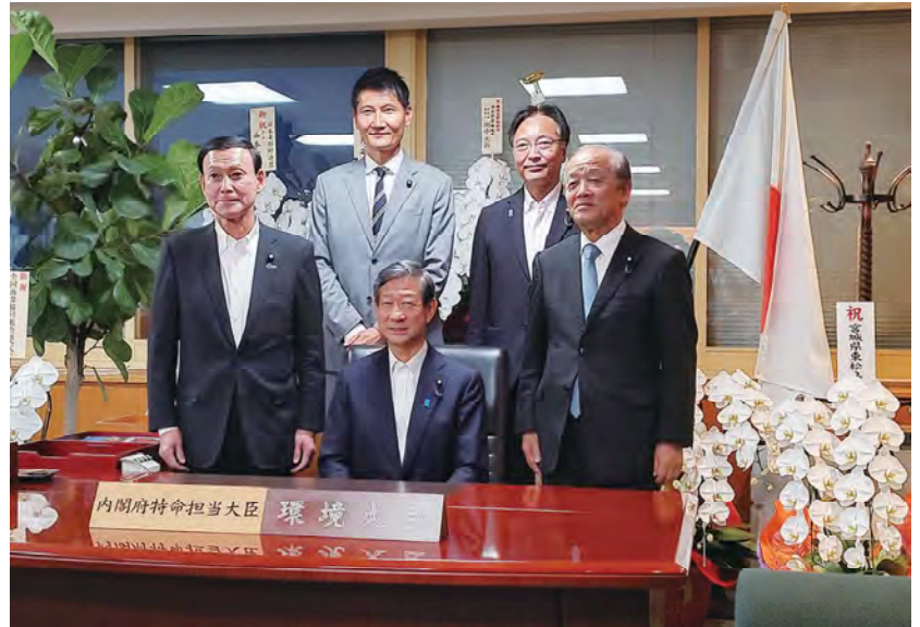
■政務三役初顔合わせ