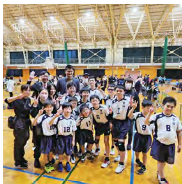
■加茂ウインターカップ大会視察へ