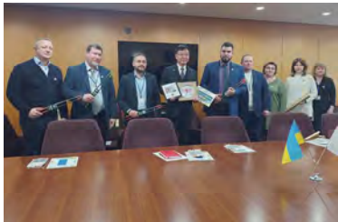
ウクライナ国廃棄物処理担当官の 表敬面談