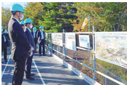
中間貯蔵施設・サンライト大熊視察（福島）