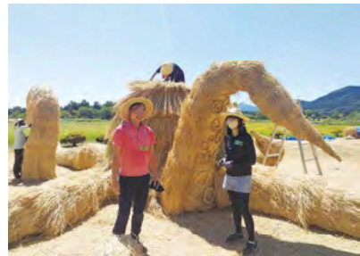
わらアートまつり (西蒲区)