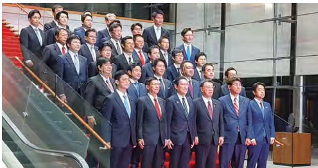
■環境大臣政務官兼内閣府大臣政務官就任 (第2次岸田第2次改造内閣)