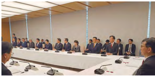
第21回総合海洋政策本部会合