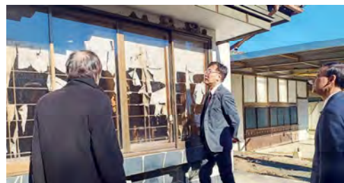
双葉町特定帰還居住区域視察（福島）