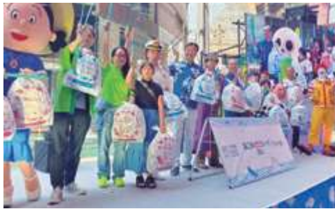
■春の海ごみゼロウィークブースイベント (福岡県福岡市)