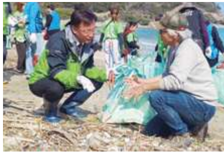
■対馬海ごみ視察：日韓ビーチクリーンアップ (長崎県対馬市)