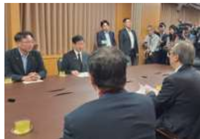
■花角英世新潟県知事要望:原子力防災