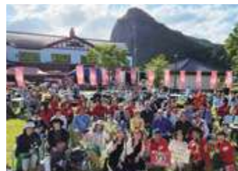
■参加者のみなさんと