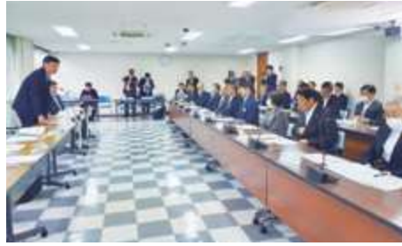
■室蘭市長との面会：高濃度PCB廃棄物の受入れ要請に関する意見交換 (北海道室蘭市)