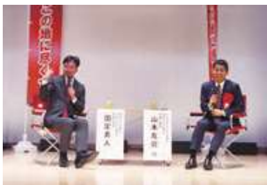
■田上地区国政報告会(田上町交流会館)