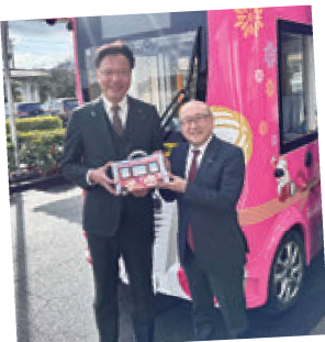
■自動運転実証調査事業視察(弥彦村)