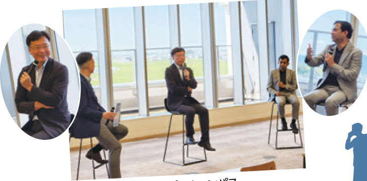
■三条市立大学オープンキャンパス シャリアル学長とのパネルディスカッション