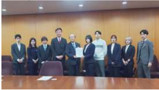
■ユース連合によるプラスチック国際条約への政策提言