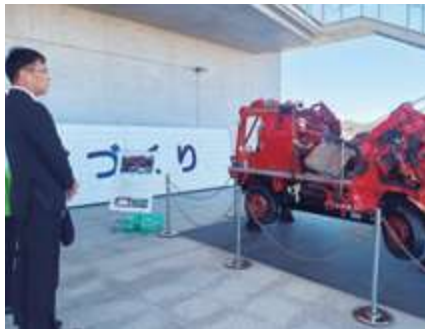
■東京電力廃炉資料館視察～東日本大震災・原子力災害伝承館 (福島県双葉町)