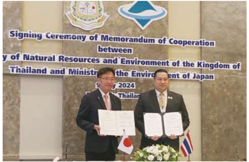
■ラチャタ天然資源環境省副大臣とMoC協力の覚書更新式 (タイ王国・バンコク)

こうした多くの課題を抱える今だからこそ、座右の 銘である「愚直」の二文字を改めて深く心に刻んで臨 んでいく所存でありますので、引き続きのご指導を賜 りますようお願い申し上げます。