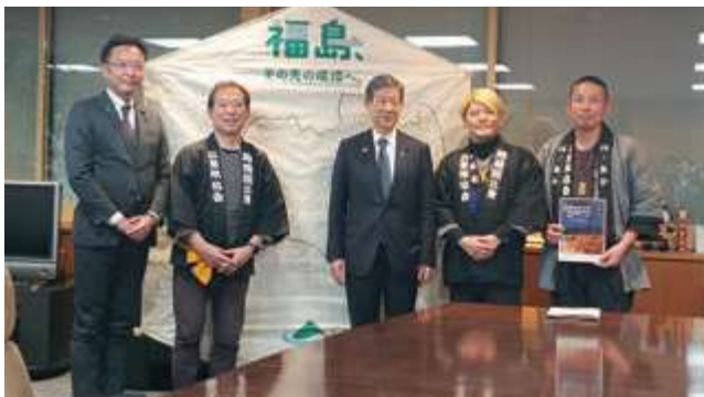
■3.11 夢の大風あげ 三条風協会が伊藤信太郎環境大臣と面会