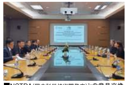
■NSTDA(国立科学技術開発庁)との意見交換 (タイ王国・バンコク)