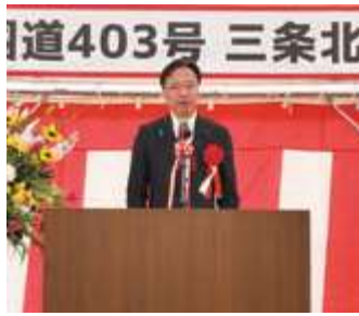
■国道403号三条北道路「開通式」