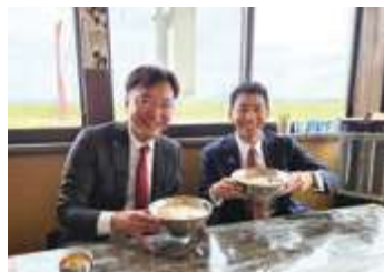
■燕三条背油系ラーメンを堪能