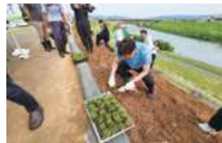
朝草会 水害復興植栽事業 (五十嵐川)

『いいさとの会』ご入会と更新のお願い お申込み・お問い合わせは 0256-47-1555 まで