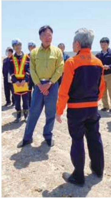
■能登半島地震視察 (石川県珠洲市)