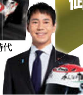
■山本左近 衆議院議員