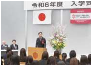
■三条看護・医療・歯科衛生専門学校入学式