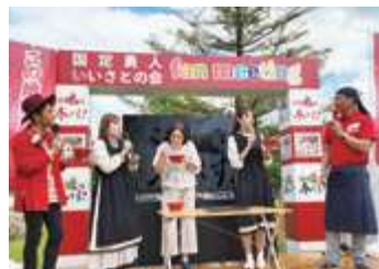
■味はいかが? くにさだラーメン試食