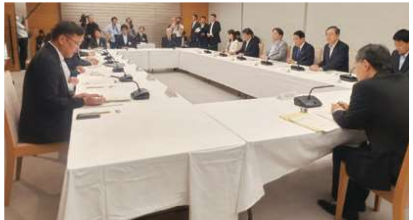
■我が国の物流の革新に関する関係閣僚会議