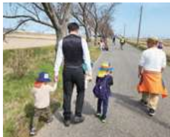
■根岸地区ウォーキングと清掃ボランティア(新潟市南区)