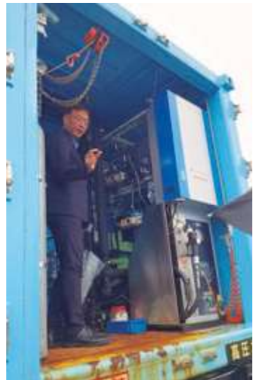
■DENZAI環境科学館・水素実証視察 (北海道室蘭市)