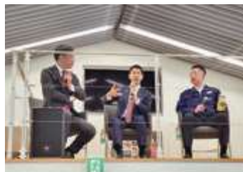
■㈱マルト長谷川工作所 長谷川直哉社長を交えてのトークセッション

いいさとの会会員限定で行われたファンミーティングでは、元タレントの生稲晃子参議院議員にお越しいただきました。代議士お手製「くにさだラーメン」に来場者の反応は？