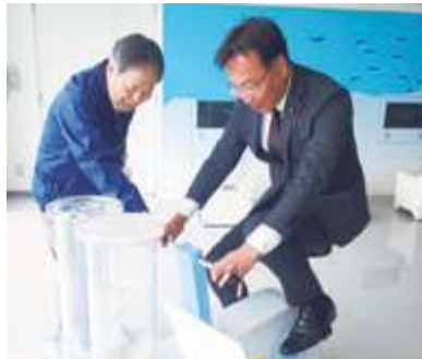
■新潟県立環境と人間のふれあい館視察 (新潟市北区)