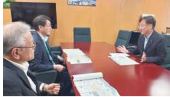
■中原八一新潟市長要望：脱炭素・廃棄物処理施設