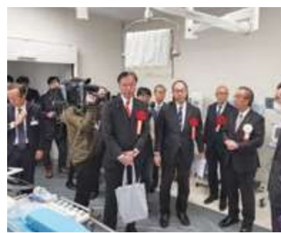
■済生会新潟県央基幹病院竣工記念式典・内覧会