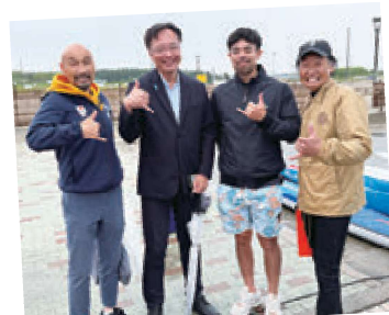
■東日本SUPLレース選手権大会(新潟市西区小針浜)