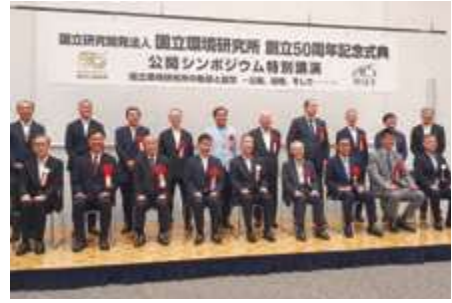
■国立環境研究所創設50周年式典