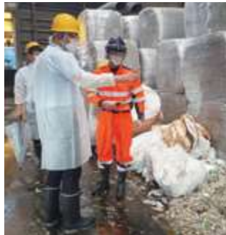
■(株)グリーン視察 (神奈川県横浜市)