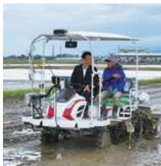
■めざせ先進的農業体験会(燕市)