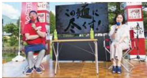
■生稲晃子参議院議員とのトークショー(三条市いい湯らてい)