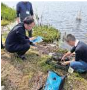
■佐潟・御手洗潟 現況視察(新潟市西区)