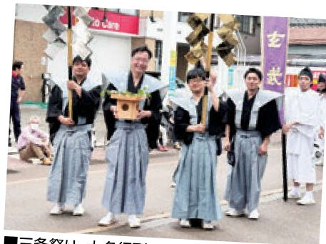
■三条祭り 大名行列に参加